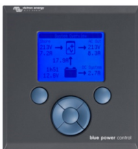
Tableau de commande Blue Power

Une solution pratique et bon marché pour une surveillance à distance, avec un bouton rotatif pour configurer les niveaux de Power Control et Power Assist.