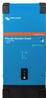
Inversor Phoenix Smart 12/2000